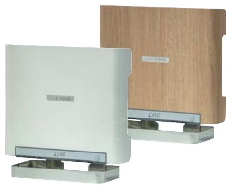
業務用 室内専用オゾン発生装置 AIR FINO エアフィーノ VS-50S